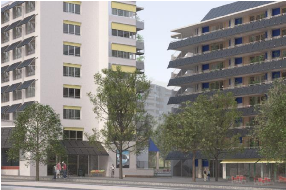
Blick auf den neuen Quartierplatz (Bild: Donet Schäfer Reimer Architekten, Zürich)

Wohn- und Gewerbesiedlung Guggach, Hofwiesenstrasse 189, 8057 Zürich