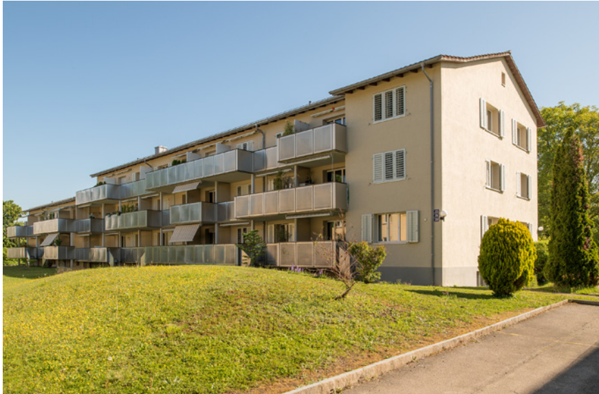
Riedenhaldenstrasse 72 / 74 / 76